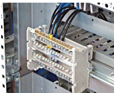
Esempio di cablaggio Example of cabling