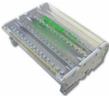
Immagine del prodotto / Product image