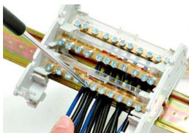
Facilità nel cablaggio Easy cabling