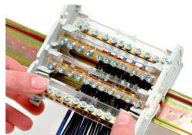
Montaggio barrette asportate Assembling of the bars